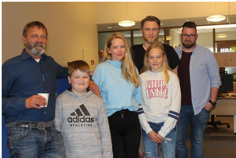
Skuespillerne fra Atlanterhavsspelet